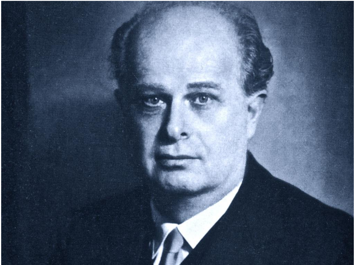
Adriano Olivetti [Ivrea 1901 – Aigle (Svizzera) 1960]