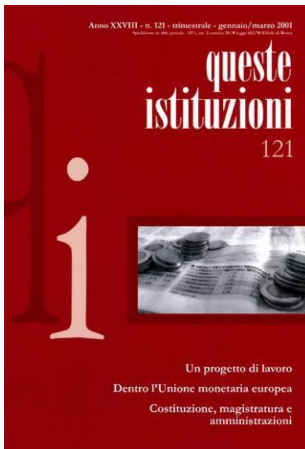
Sopra: una delle tante copertine del Periodico “Queste Istituzioni: cronache del sistema politico” , nato nell'estate-autunno 1973. Sotto: la copertina n. 0, anno 1, che riporta l'indice dei temi trattati