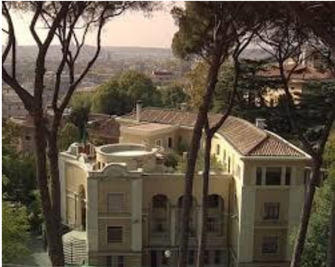
Villa Lubin, a Roma, sede del CNEL, in due delle rare foto sul Web che illustrano l'importanza artistico-storico-architettonica dell'edificio ospitato all'interno del parco della Villa Borghese