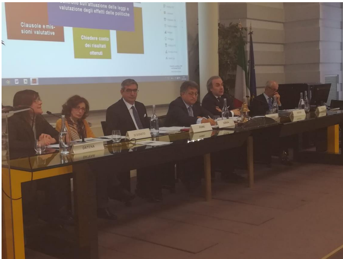
Due immagini del Convegno tenuto a Matera il 12 marzo 2019 sul tema “Progresso e sviluppo economico. Il futuro che si prepara ai giovani”